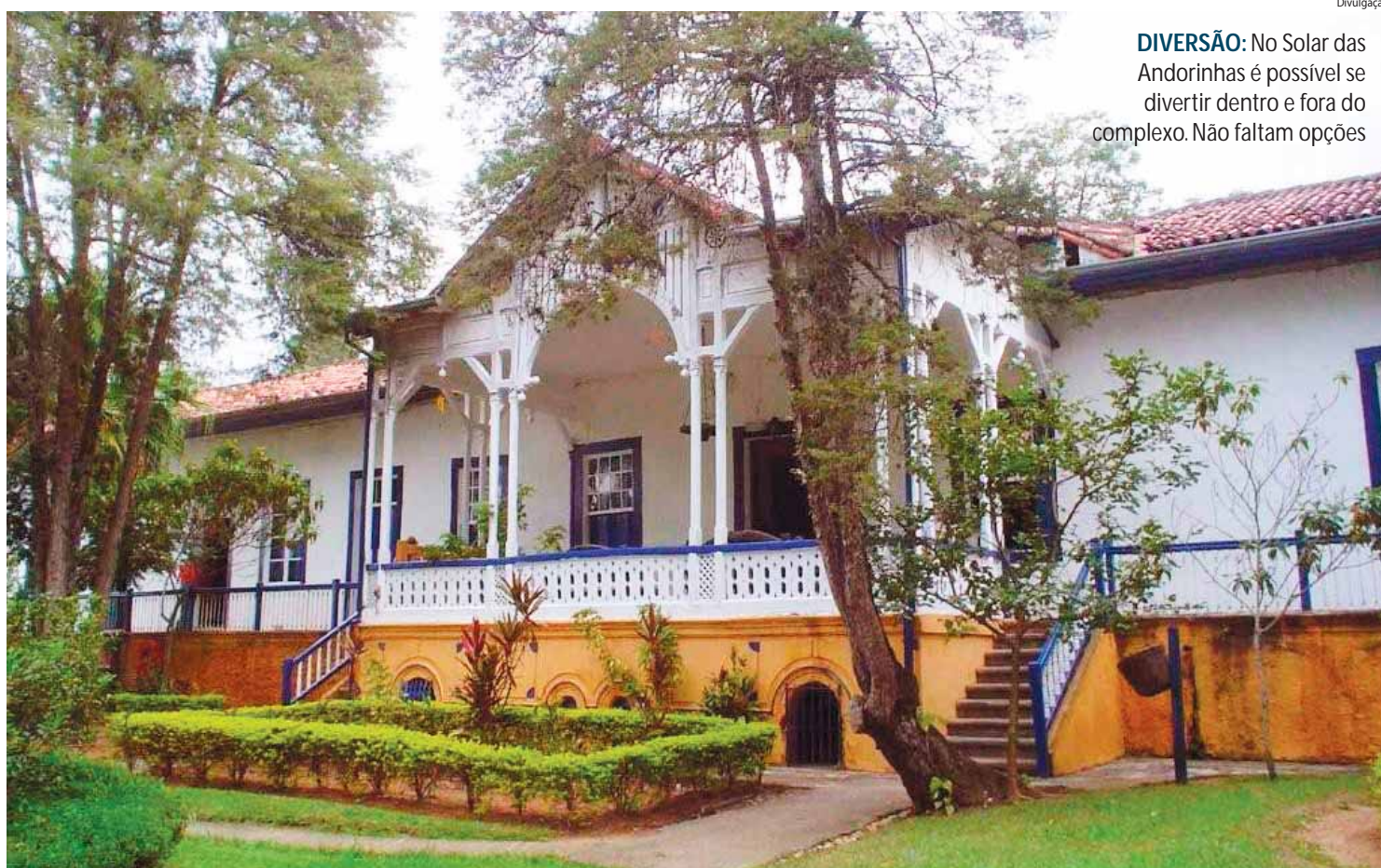
DIVERSÃO: No Solar das Andorinhas é possível se divertir dentro e fora do complexo. Não faltam opções

O Solar dos Bebês consiste em uma grande sala de recreação